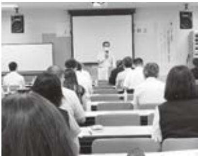
上越市ご担当者様

『「必須！再確認！移住・空家対策等 支援制度の最新事情」～適切な情報提供で、移住者の心をキャッチしよう！～』をテーマに上越市・妙高市・糸魚川市の担当者から支援制度の最新情報の説明を受けました。コロナ禍で首都圏にお住いの方がテレワークなどの労働環境の変化を受けて、自然に恵まれた地方に移住を考える人が増えている現状から、各市は様々な助成金などの制度を設けており、それらの最新情報を的確にお客様に提供することが不動産業者に求められています。スムーズな行政との連携が必要であると実感されました。今回の研修を機に不動産業者と各市とのつながりも更に近くなり、情報の共有や相談などがしやすい環境をつくることのできたのではないかと思います。今後も行政との連携をしっかりと継続しながら、お客様が安心して移住や空家の相談に来れる不動産業者になることの必要性和意義を深く感じることのできる研修となりました。