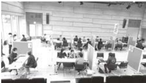
たくさんの方が相談に訪れました

当日の相談者数は25組あり、そのうち宅建協会は10組、弁護士5組、建設業協会4組三条市9組(複数への相談者あり)、特別セミナー参加者は27名でした。