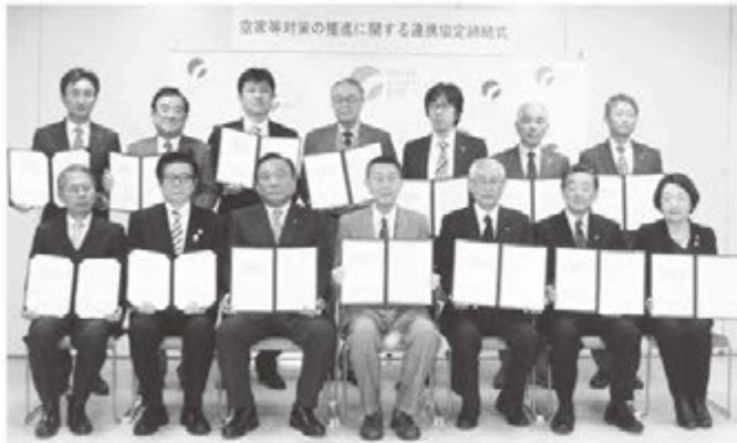
空き家問題解決のため 13 団体の包括協定