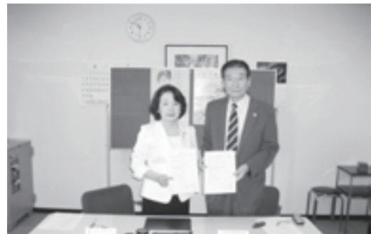
覚書を取り交わす相羽会長(左側)と小林会長