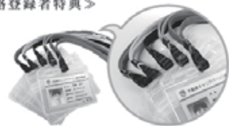
ネックストラップ (他の色が全5色からお選びいただけます)

※詳細につきましては全宅連ホームページ http://www.zentaku.or.jp/ でご確認下さい。